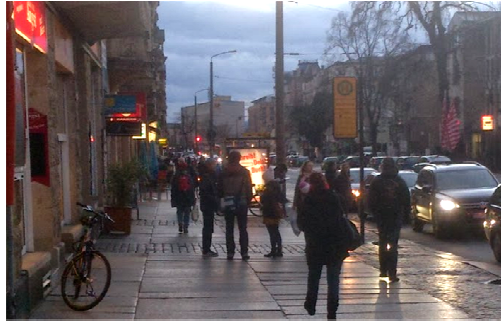
Königsbrücker Straße am 10.01.2014

Verbreiterung der Straße von 10 m auf 17 m mit 4 Lkw-tauglichen Fahrspuren zu Lasten der vorhandenen Parkplätze, Gehwege, Baumallee